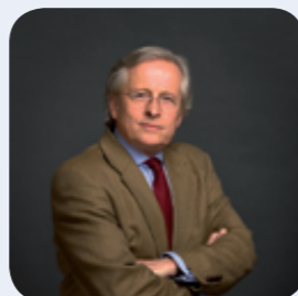
E. Veen, Hermitage Amsterdam

Museum Hermitage Amsterdam is dagelijks geopend. Tot 31 januari 2010 is de eerste tentoonstelling met het thema “Aan het Russische hof” te bezichtigen. Meer informatie: www.hermitage.nl