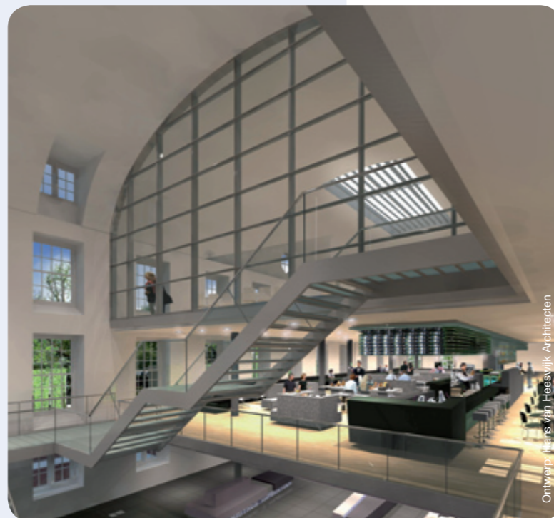
Ontwerp: Hans van Heeswijk Architecten