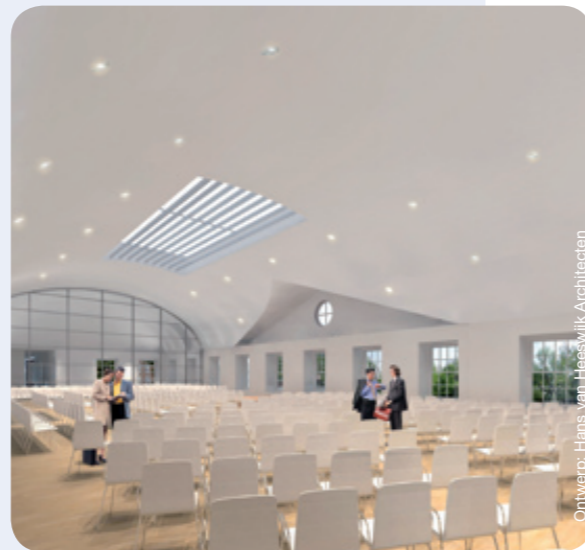
Ontwerp: Hans van Heeswijk Architecten

Daglicht speelt in het hele museum een belangrijke rol. “Het pand had veel donkere hoeken. Zo waren de hoeken boven de wenteltrappen volledig dicht. De architect is erin geslaagd om via de bestaande ramen en lessenaardaken boven de trappen daglicht van bovenaf naar binnen te laten vallen. Je loopt nu vanuit de 102 meter lange gangen naar het licht toe.”